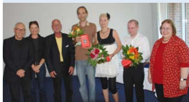
Die Jubilare des Centers Kreuzberg...