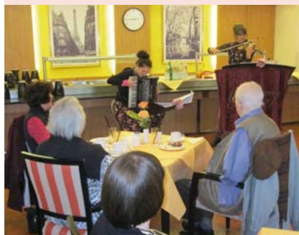
... und die Musikerinnen von Muzet Royal ...