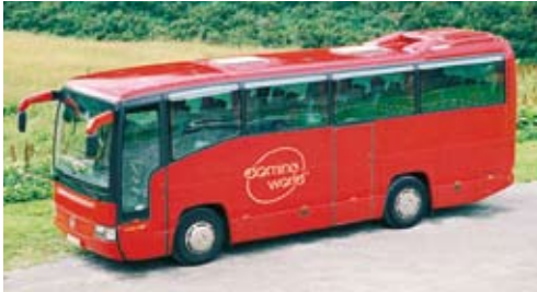
domino-world™ Kundenclub-Reise (Seite 3)

... jüng bleiben! Das domino-world™ Kundenmagazin Nr. 3/2011