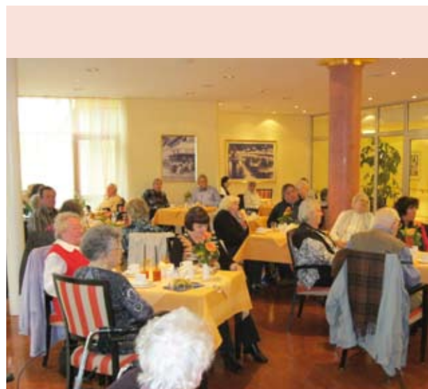
Kaffee und Kuchen im Club Tegel ...

Keiner kommt von einer Reise so zurück, wie er weggefahren ist.