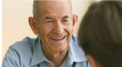
domino-world™ Kundenclub-Quiz (Seite 4)