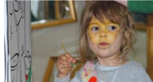
domino-world™ Kinderfest (Seite 5)