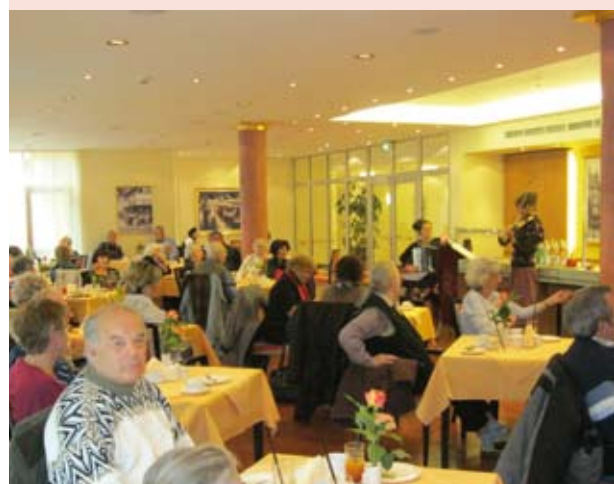
... sorgten für einen schönen Abschluss der Kundenreise.