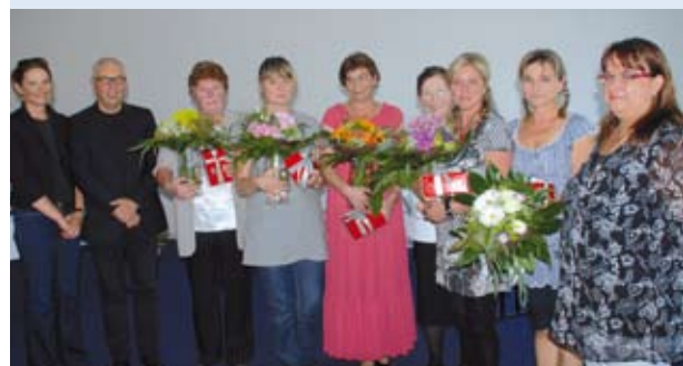
... und die des Centers Hennigsdorf werden ausgezeichnet.