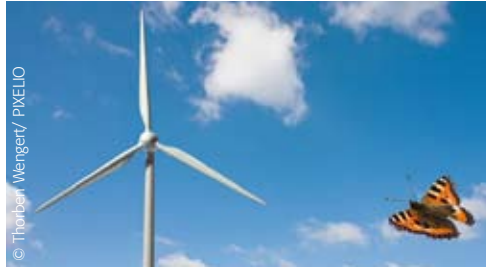
Umweltschutzmanagement (Seite 5)