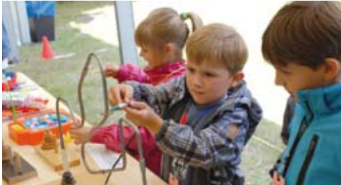
domino-world™ Kinderfest (Seite 2)