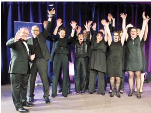
Die Führungskräfte von domino-world™ bei der Preisverleihung

domino-world™ zum zweitbesten Arbeitgeber Deutschlands gewählt – 5. Platz in Europa