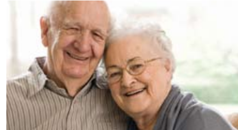
Neue Geschichten zum Gesund- werden (Seite 7)