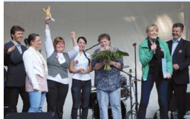
Gewinner 2011: Das Team EG des Clubs Tegel

Am 2. September wurden auf unserem alljährlich stattfindenden Sommerfest die Gewinner des nunmehr 7. domino-world™-Excellence-Preises für Mitarbeiterteams geehrt.