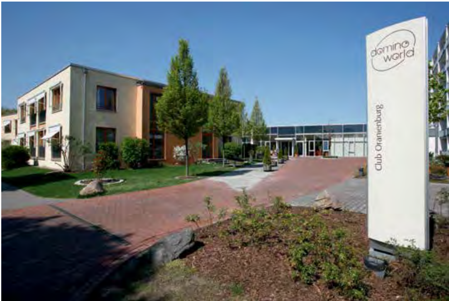
Der domino-world™ Club Oranienburg

Das Instrument „Wissensbilanz – made in Germany“ des Fraunhofer Instituts ermöglicht jedem Anwender über das Sichtbarmachen des intellektuellen Kapitals hinaus eine fundierte Priorisierungsmöglichkeit von Prozessverbesserungen – damit wird die Wissensbilanz zum „Motor“ von Entwicklung und Fortschritt im Unternehmen.